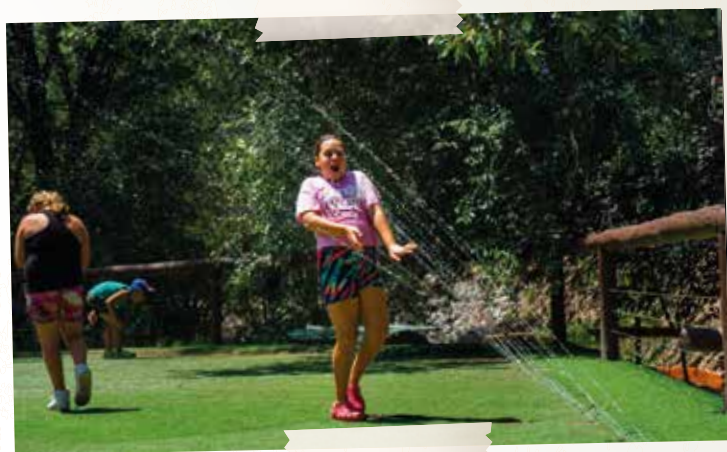
Chorritos de agua